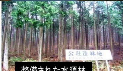
整備された水源林