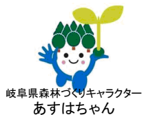
岐阜県森林づくりキャラクター あすはちゃん